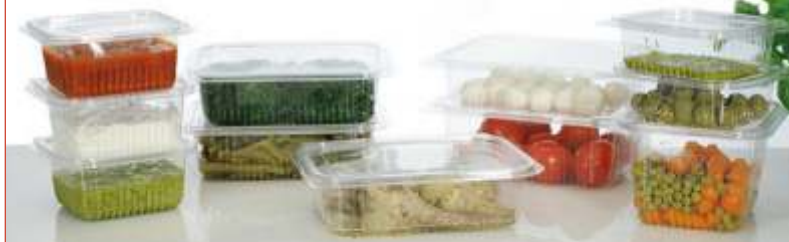
OPS-Schalen ECKIG mit anhängendem Deckel